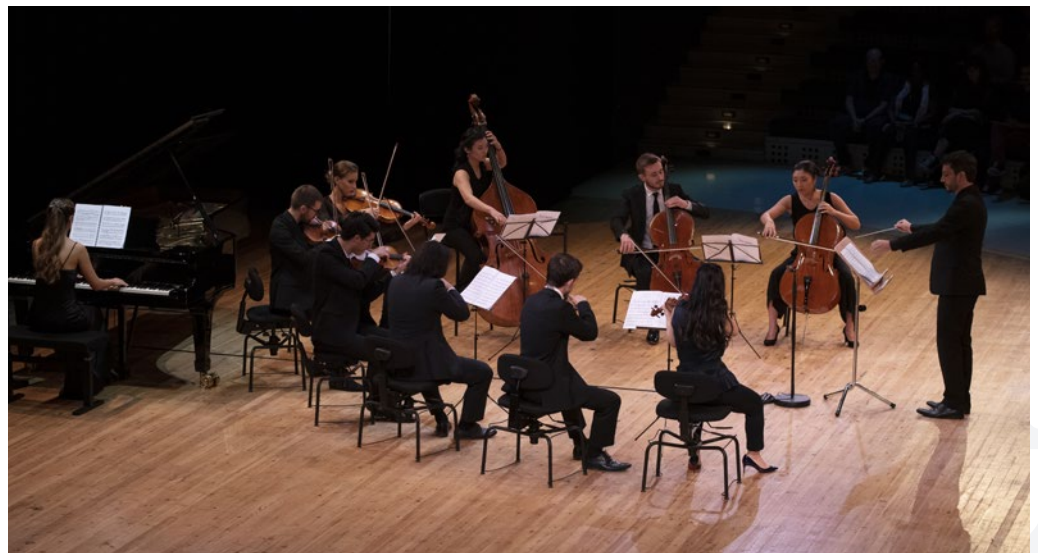
Ci-contre : les musiciens en résidence lors du concert du 19 septembre 2019.